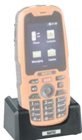
Рисунок Описание Номер для заказа

Настольная зарядная станция для зарядки Mobile X со вставленным аккумулятором Входное напряжение: переменное, AC 100 - 240 В Включает в себя: 1 x настольная зарядная станция 1 x UaSB-адаптер к зарядному устройству 1 x USB-кабель с i.safe PROTECTOR